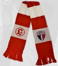
FANSCHAL 14,47 Euro