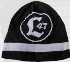
WOLLMÜTZE DICK 12,47 Euro