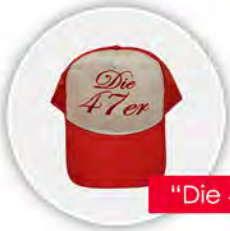
“Die 47er” Cap