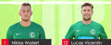
1 Niklas Wollert