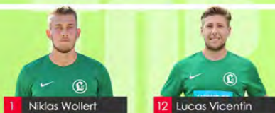
1 Niklas Wollert