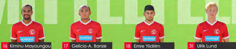
16 Kiminu Mayoungou