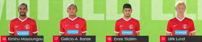
16 Kiminu Mayoungou